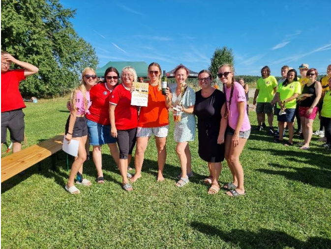
MŠ a ZŠ ve Štěpánovicích.

Soutěž mladých hasičů Plamen V sobotu 6.5 2023 proběhlo ve Štěpánovicích obvodové kolo soutěže mladých hasičů Plamen. Soutěže se zúčastnilo 9 družstev mladších a 11 družstev starších. Hasičská soutěž O pohár starosty obce Štěpánovice Sbor dobrovolných hasičů Štěpánovice pořádal hasičskou soutěž O pohár starosty obce Štěpánovice. Největší úspěch mělo pro Štěpánovice družstvo žen nad 30 let, které ve své kategorii zvítězilo.